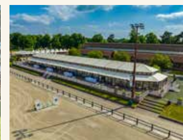
Le Pavillon de Jardy