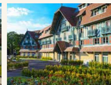
L'Hôtel Renaissance Paris Hippodrome de St Cloud 4*